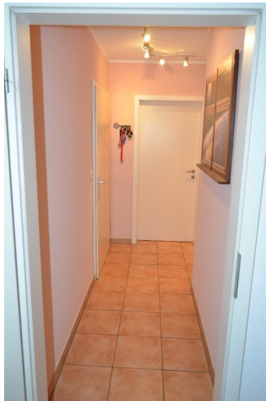
Blick in den Flur vom Schlafrum – links Wohnungseingangstür