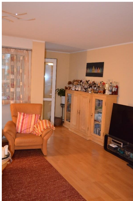
Wohnzimmer mit Ausgang zur Terrasse zur Straße