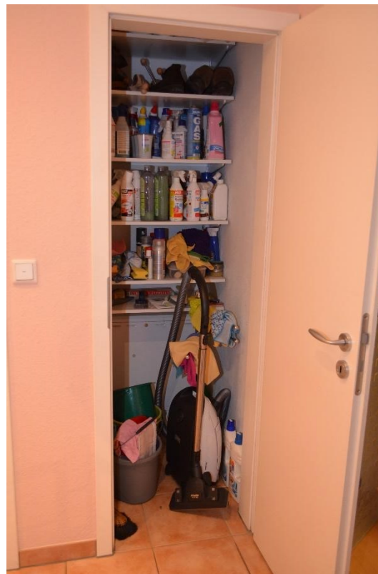
Abstellkammer im Flur