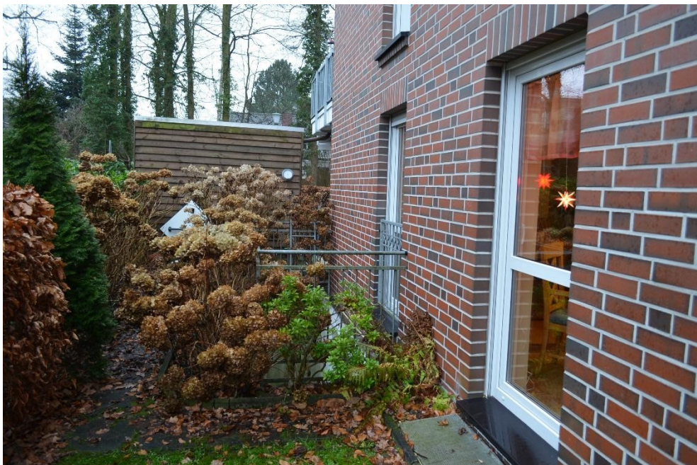
Blick vom Garten auf das Carport