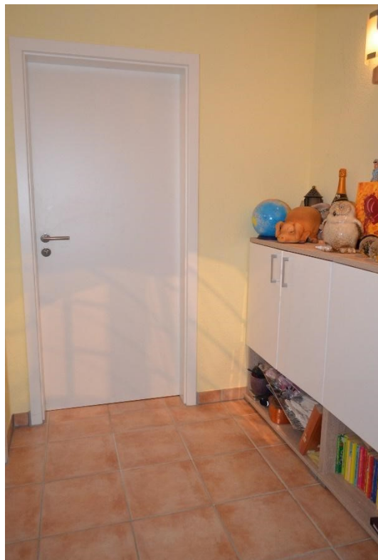
Flur im Souterrain