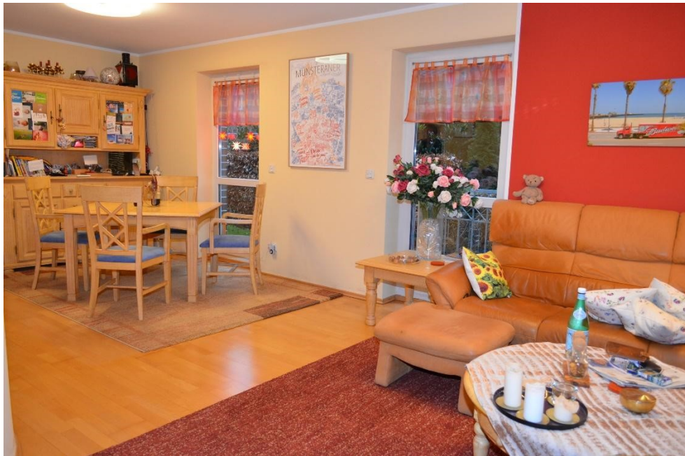
Blick vom Wohnzimmer ins Esszimmer