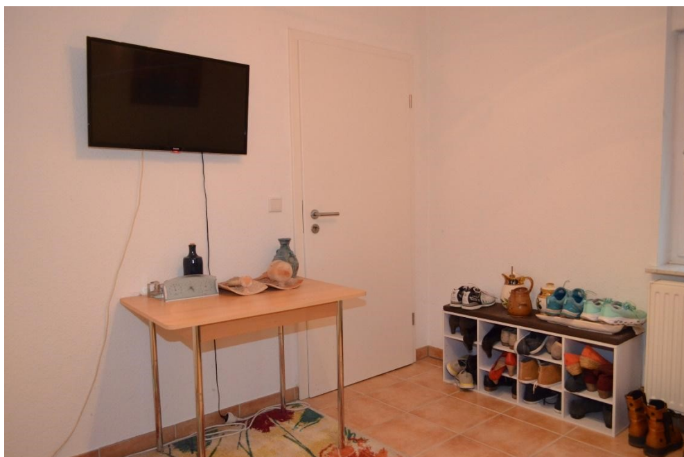
Zweites Zimmer im Souterrain mit Zugang zum Keller