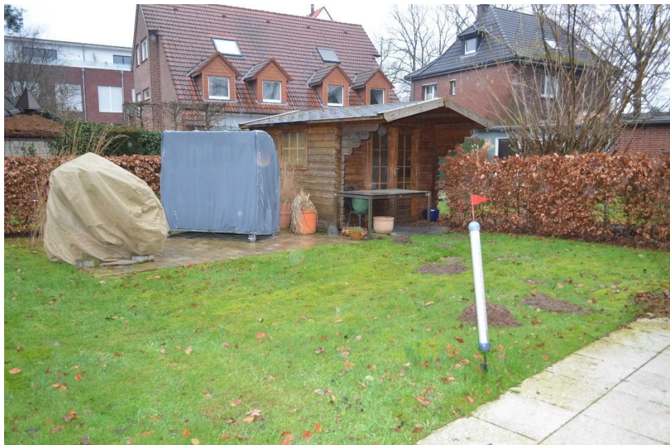
Gartenbereich von der Küche aus