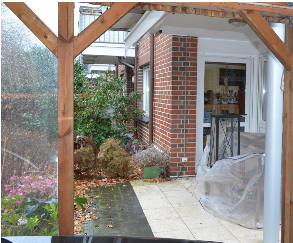
Zugang vom Carport zur Terrasse