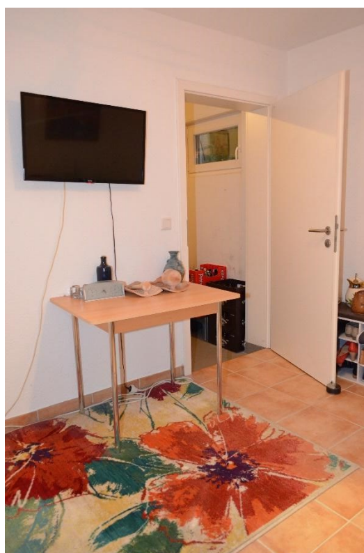
Zugang zum eigenen Kellerraum