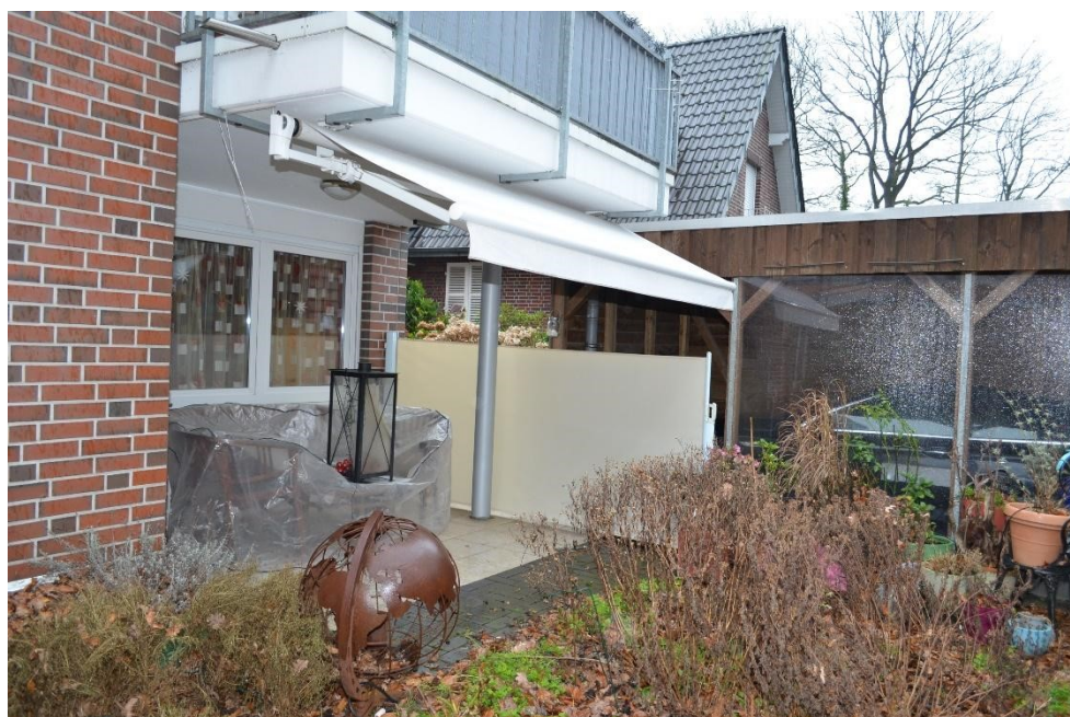
Terrasse vom Wohnzimmer aus begehbar mit angrenzendem Carport