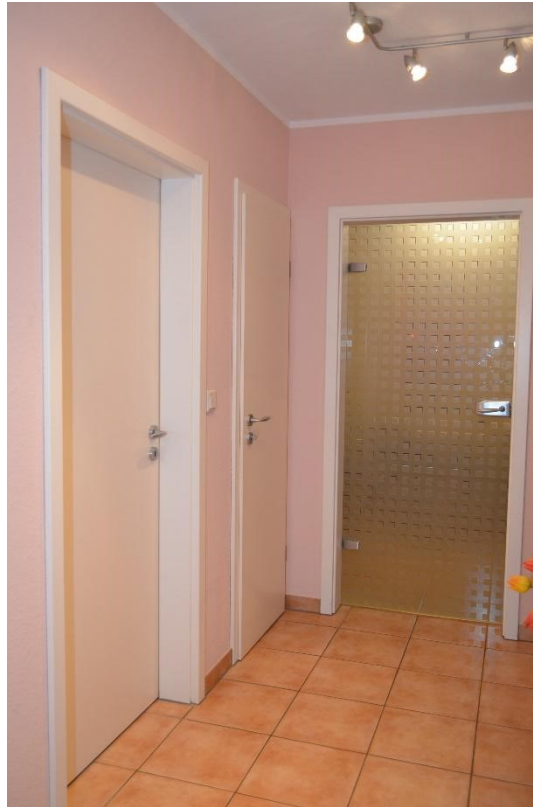
Blick von der Wohnungseingangstür zur Glastür des Wohn-/Esszimmers