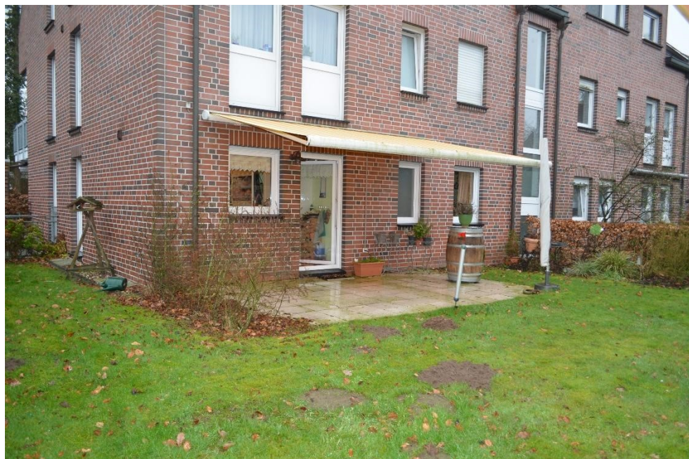
Blick aus dem eigenen Garten auf die Terrasse