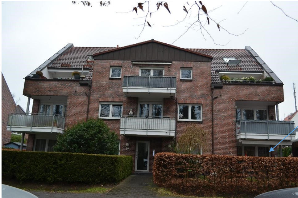
Ansicht von der Straße