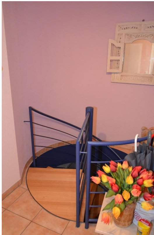
Wendeltreppe zum Souterrain