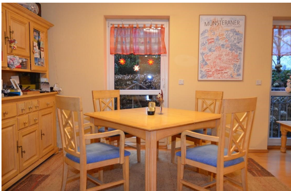
Essbereich im Wohn-/Esszimmer