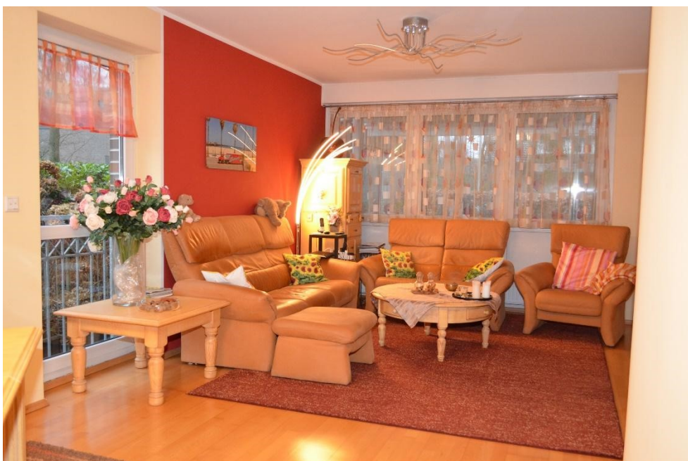
Wohnzimmer vom Essbereich